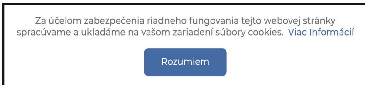
Obrázok č. 1 – nesprávne nastavenie

Pre doplnenie k obrázku č. 1 je potrebné uviesť, že uvedené nastavenie je nesprávne v prípade, ak takýto cookie banner prekryva celú webovú stránku a užívateľ nevie webovú stránku prehliadať bez toho, aby neklikol na „Rozumiem“ – a teda nemá žiadnu inú možnosť výberu, ide o neplatný súhlas. Taktiež je nevyhnutné upozorniť, že formulácia „Rozumiem“ v tejto súvislosti nie je správna, pretože nevyjadruje súhlas. Pre účely získania platného súhlasu je potrebné používať jednoznačnú formuláciu napríklad „Súhlasím“ alebo „Prijať“.