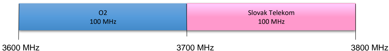
Obrázok 5.2: Rozdelenie frekvencií vo frekvenčnom úseku 3600 – 3800 MHz od 1.9.2025

Rozdelenie frekvencií vo frekvenčnom úseku 3600 - 3800 MHz po 1.9.2025 je znázornené na obrázku č. 5.2.