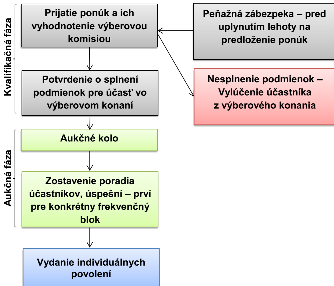
Obrázok 1: Vývojový diagram priebehu výberového konania