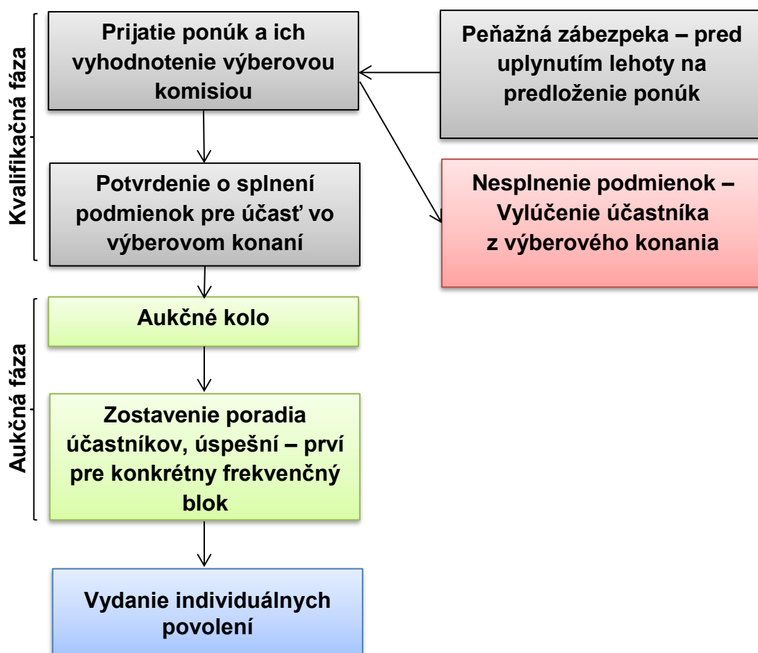
Obrázok 1: Vývojový diagram priebehu výberového konania