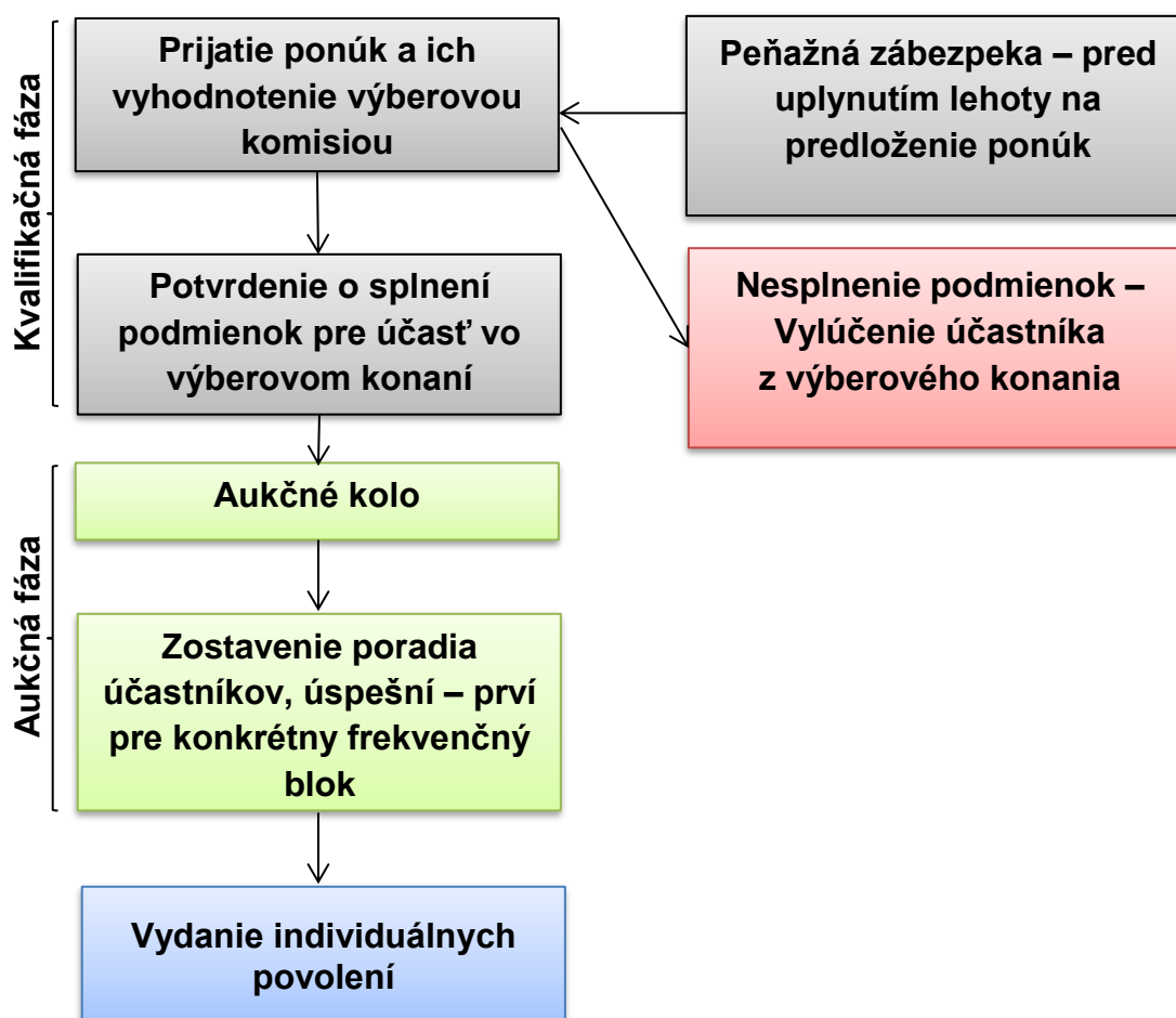
Obrázok 1: Vývojový diagram priebehu výberového konania